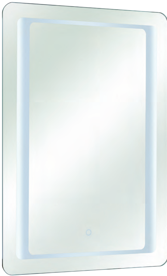
Spiegel 21-I inkl. Touchsensor, 12 V LED, 15 W, 790-1190 Lumen