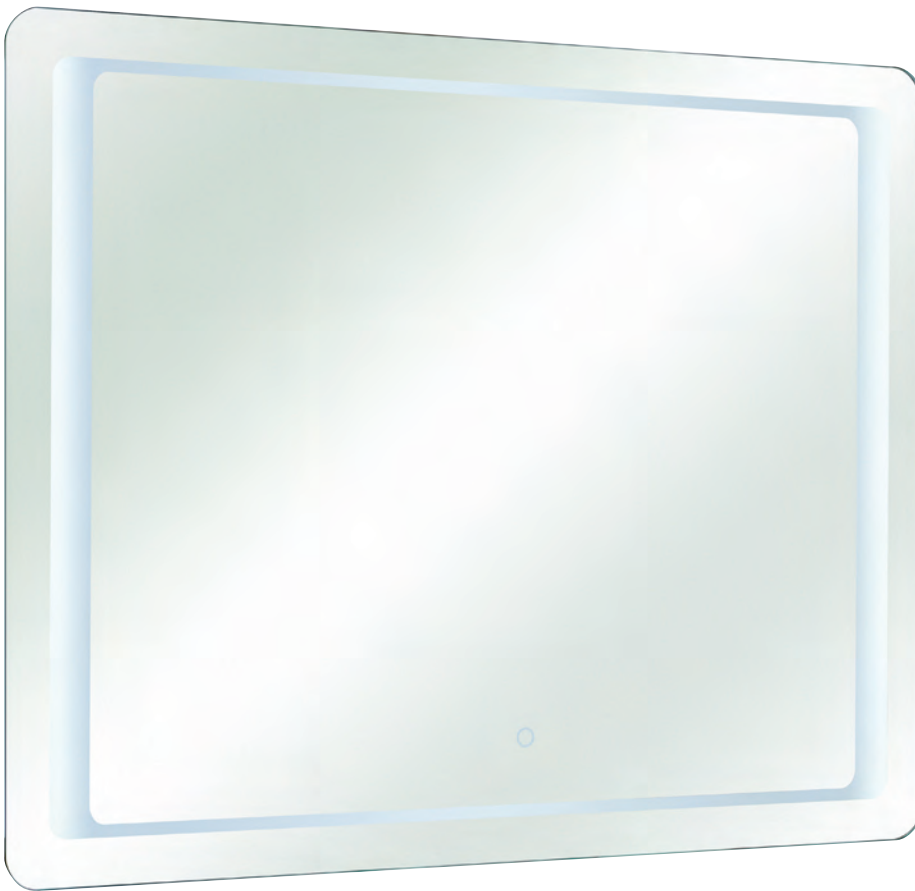
Spiegel 21-III inkl. Touchsensor, 12 V LED, 20 W, 1110-1290 Lumen